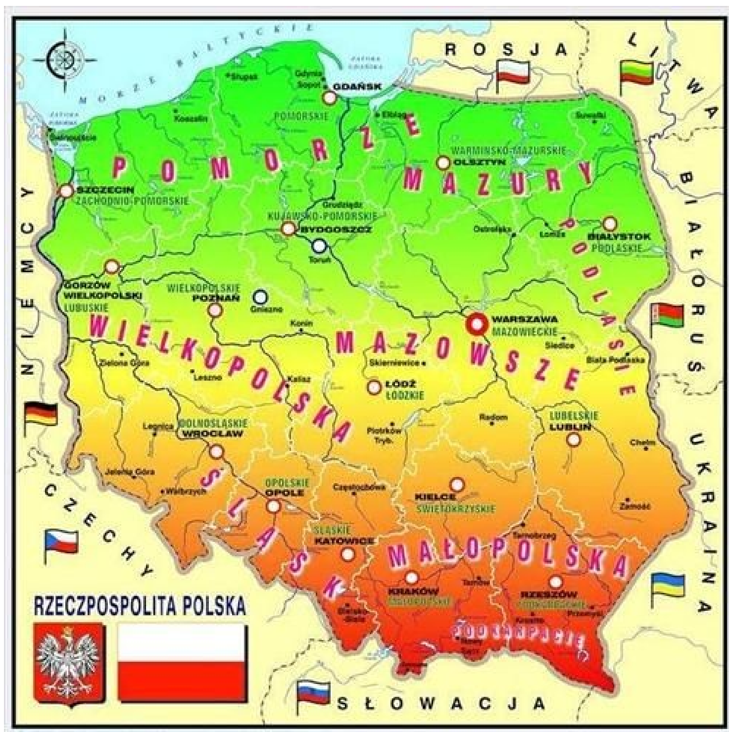
Mapa Polski dla dzieci